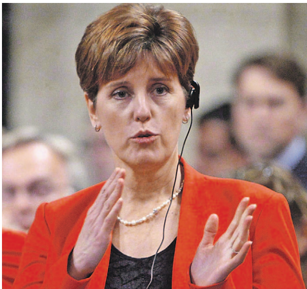
La ministre du Développement international, Marie-Claude Bibeau, a annoncé des investissements majeurs en recherche